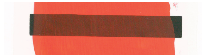
Reiner Aufstrich mit Scharlach 41 302

den über das Weiß gelegten Buntfarbtönen. Wegen des hohen Leinölanteils neigt das Weiß zur Gelbung und sollte daher nicht als reines Mal- oder Mischweiß Verwendung finden.