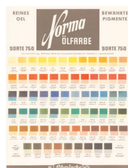
Farbkarte aus den 50er Jahren

die den Bedürfnissen der meisten anspruchsvollen Verwender entsprach. So entstand eine neue Ölfarbensorte höchster Qualität unter den Namen „ Norma® “, nach individuell auf jeden Farbton abgestimmten technisch und coloristisch optimierten Rezepturen.