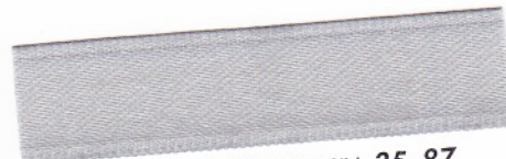
781 Silbergrau 35-87