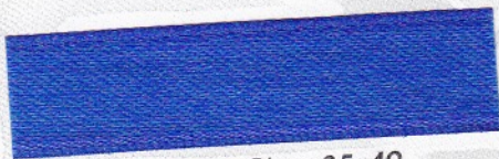
760 Blau 35-49