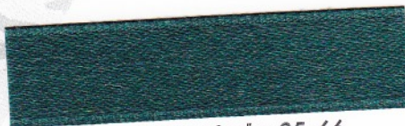
764 Tiefgrün 35-66