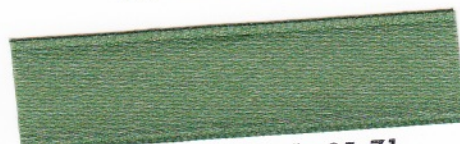
778 Grünoliv 35-71