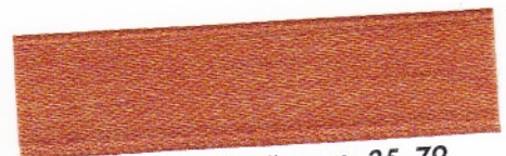
779 Rostbraun 35-79