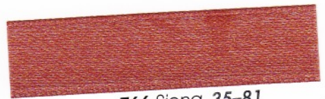
766 Siena 35-81