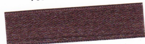
767 Tiefbraun 35-85