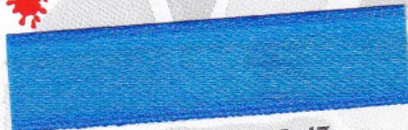
759 Azur 35-47