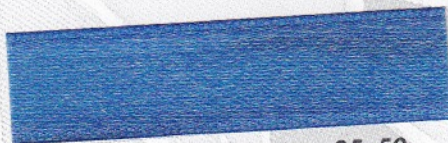
775 Rauchblau 35-50