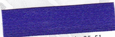
761 Ultramarin 35-51