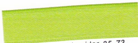
797 Waldmeister 35-73