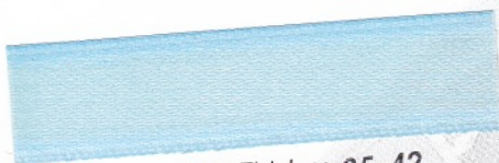
792 Eisblau 35-42