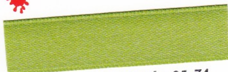
777 Pistaziengrün 35-74