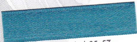
794 Petrol 35-57