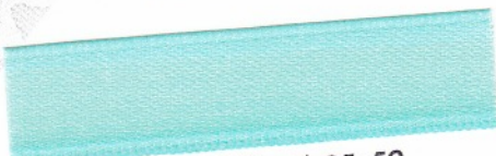
795 Opal 35-59