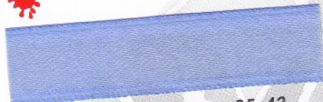
793 Rittersporn 35-43