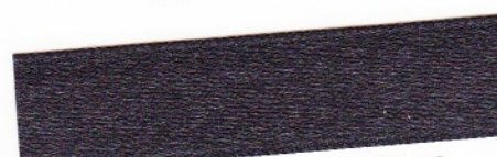
768 Schwarz 35-90