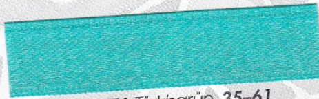
776 Türkisgrün 35-61