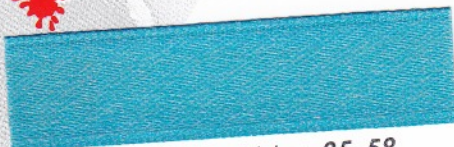
770 Türkisblau 35-58