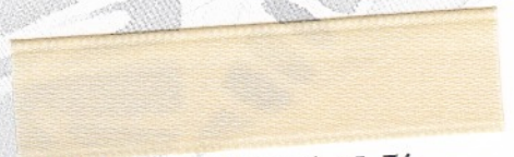
798 Sand 35-76