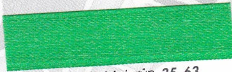
762 Maigrün 35-63