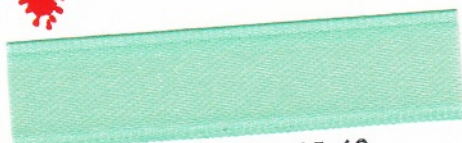
796 Mint 35-60