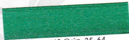
763 Grün 35-64