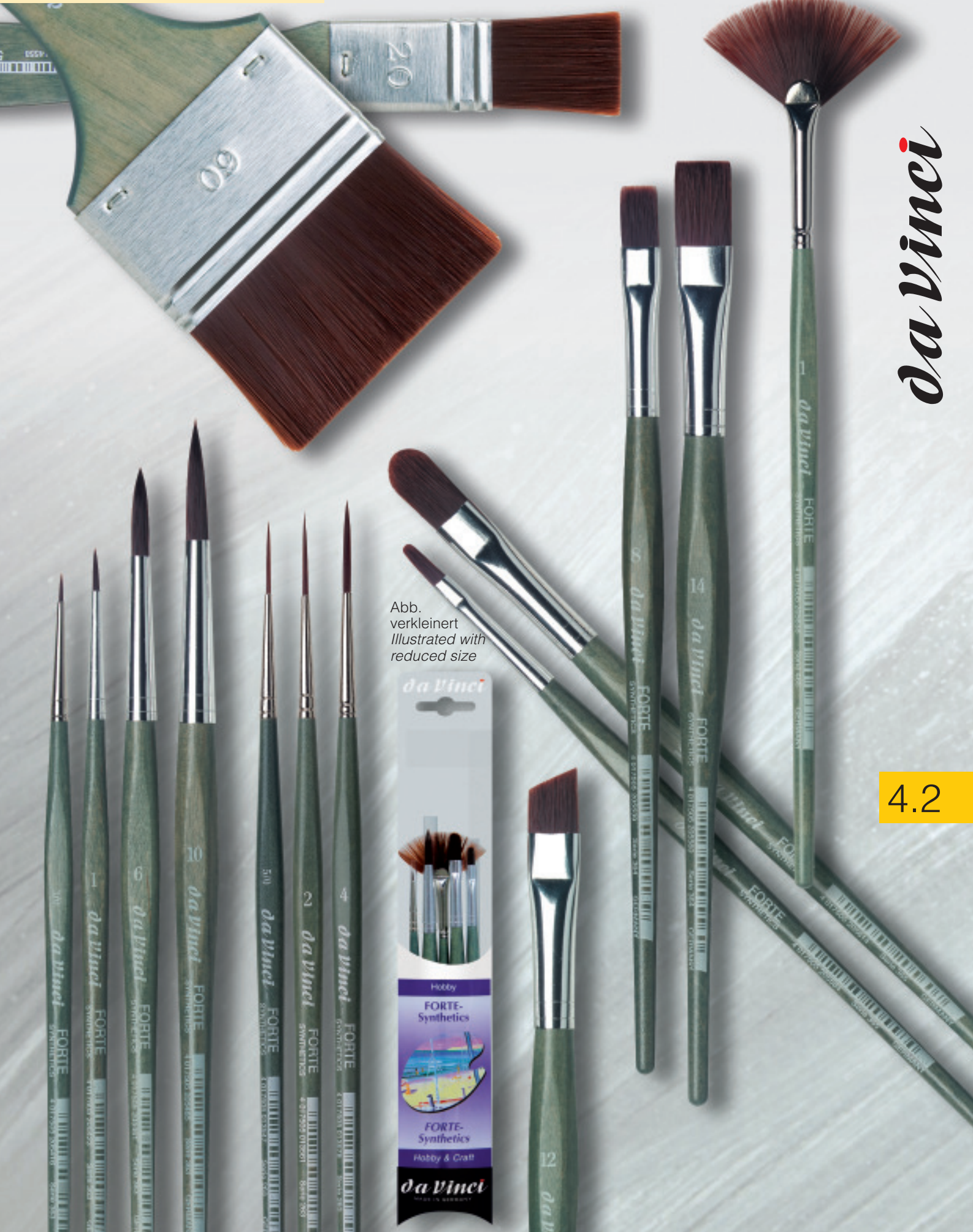
Abb. verkleinert Illustrated with reduced size