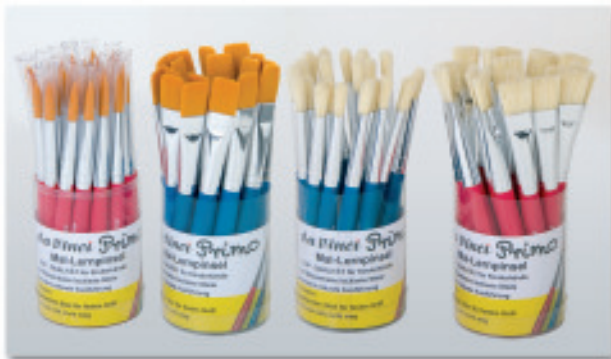
Abb. verkleinert Illustrated with reduced size