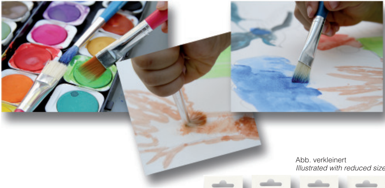
Abb. verkleinert Illustrated with reduced size

BRISTLE BRUSHES WITH BLUE HANDLES Series 5337B - 24 x 358B round Series 5338B - 18 x 359B flat