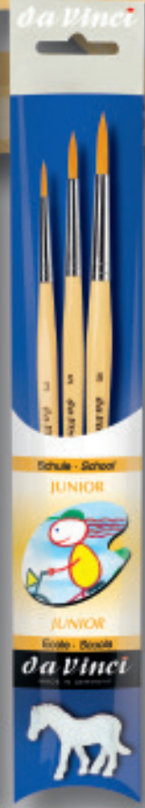
Abb. verkleinert Illustrated with reduced size