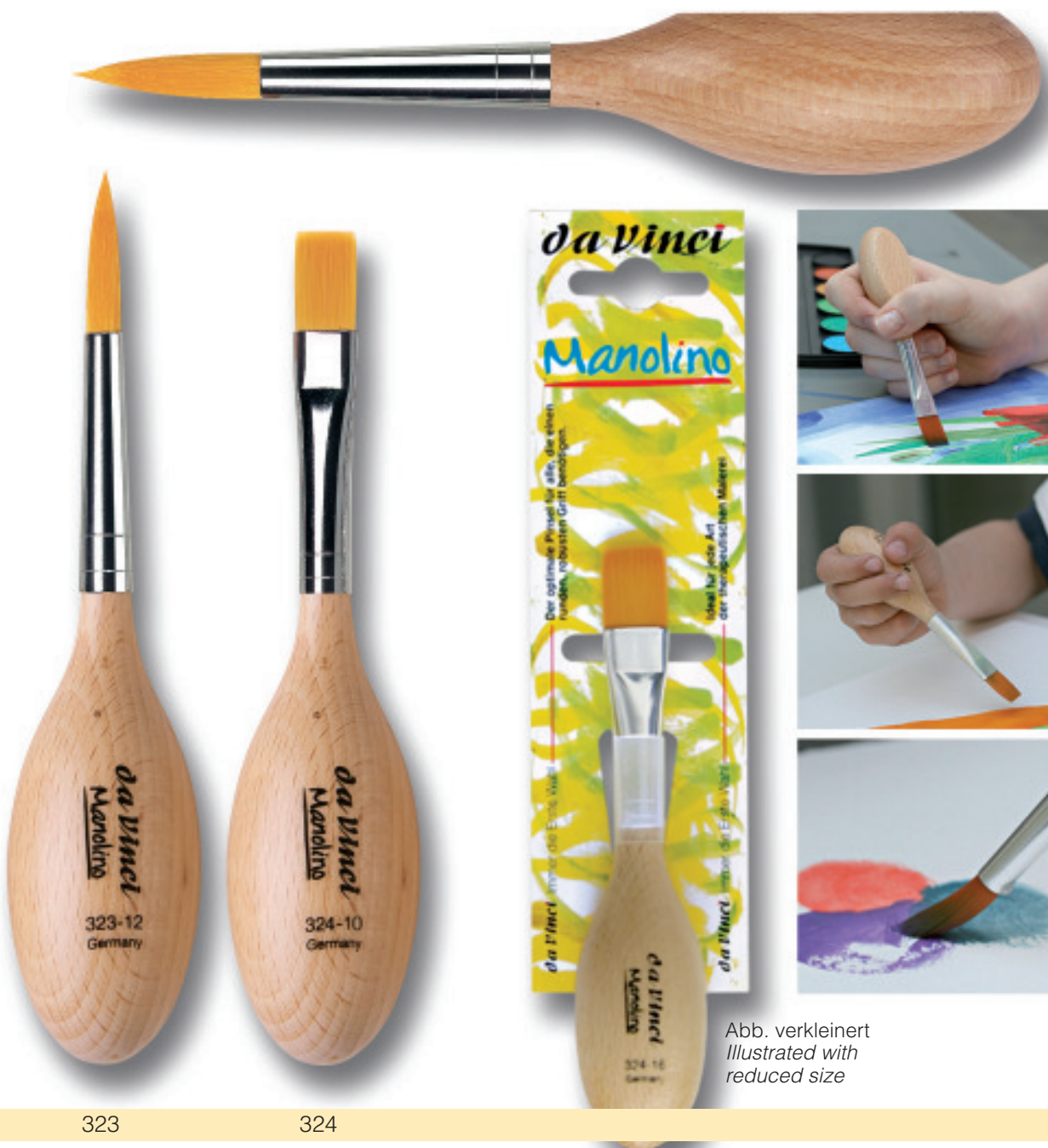
Abb. verkleinert Illustrated with reduced size