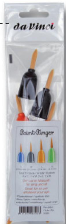
Abb. verkleinert Illustrated with reduced size

Order No. 5107 40 pieces each of sizes S - M - L - XL in total 160 brushes inclusive glass display