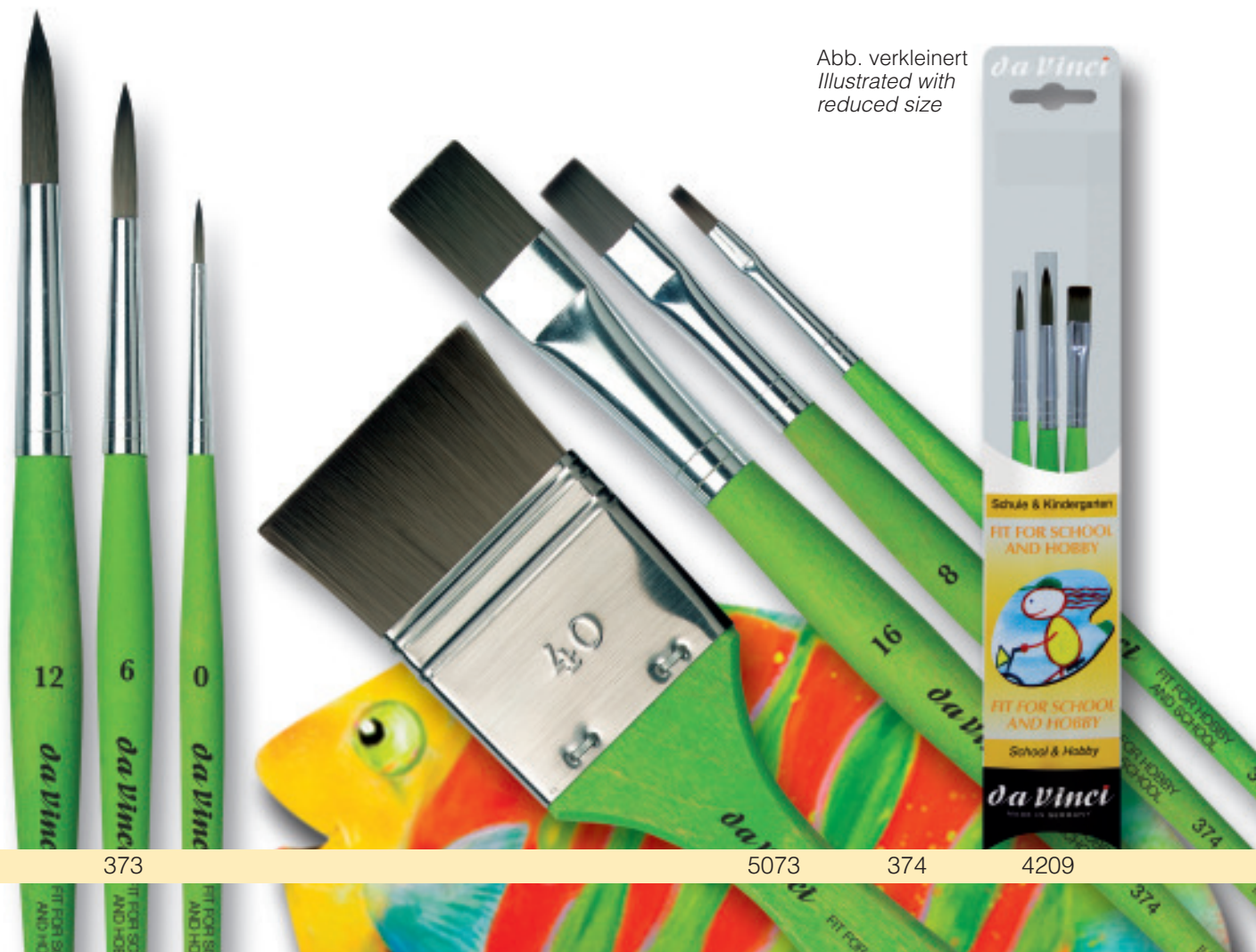
Abb. verkleinert Illustrated with reduced size