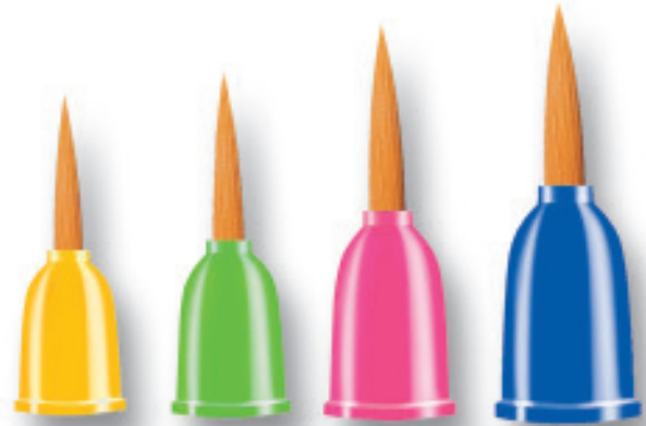
Innen/inside 5090-S 5090-M 5090-L 5090-XL Ø 10,6 mm Ø 12 mm Ø 14 mm Ø 16 mm

Bestellnr. 5089 - - - - - 4 Stück der Grösse S je 2 Stück der Grösse M - L - XL, ab 10 Stück im TAG BAG ideale Menge z. B. für Kindergeburtstage oder kleine Therapiegruppen