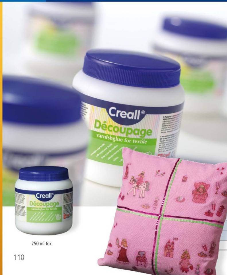
250 ml tex

vernislijm voor textiel varnish-glu for textile vernis-colle pour textile Firnisleim für Textilien