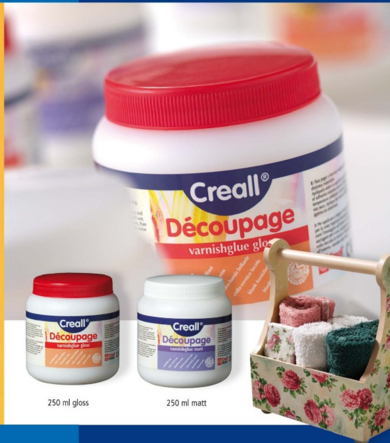
250 ml gloss

vernislijm varnish-glu vernis-colle Firnisleim